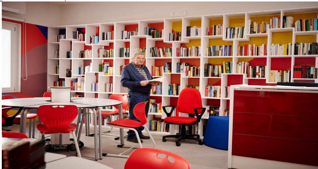
La biblioteca di Biccari - Foto di Andrea Granatiero

Per fare un paragone, nel 2022, le uscite del bilancio comunale di Biccari sono state intorno ai sei milioni di euro.