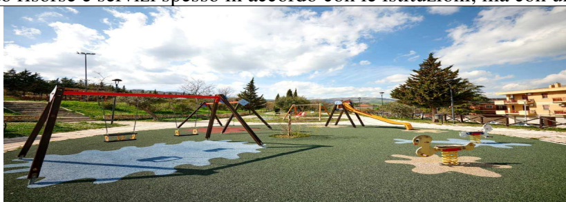
Un parco giochi a Biccari